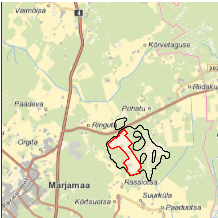
Kaardileht nr 631 Rapla